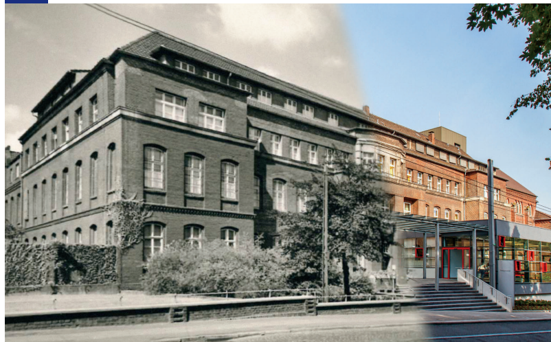
Das Philippsstift-Krankenhaus 1930/ 2021

Alte Cuesterey Borbeck 15. Februar bis 09. März 2025 Eintritt frei